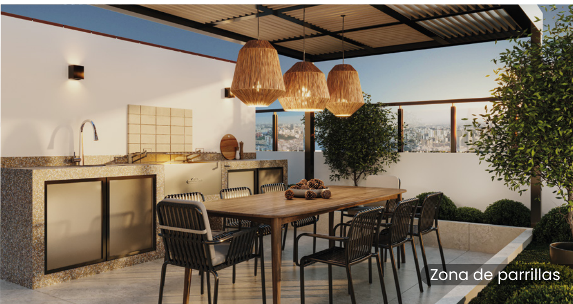
Zona de parrillas